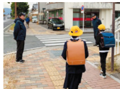
(株)アダムスセキュリティ