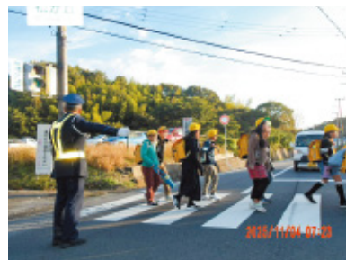
国際セーフティー(株)滋賀支店