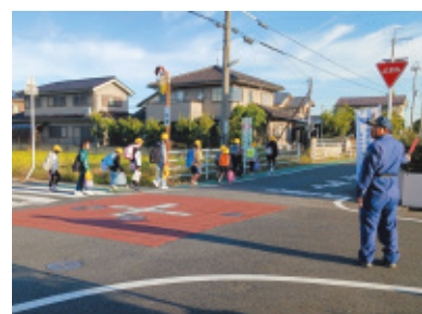
東洋ワークセキリティ(株)草津営業所