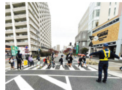
(株)テクノス総合メンテナンスサービス