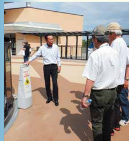
三井アウトレットパークでの 施設見学