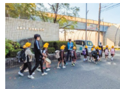
(株)メンテナンスセンター