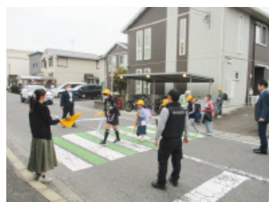
ALSOK(株)滋賀支社栗東営業所