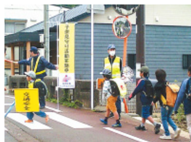
(株)アイビックス滋賀営業所