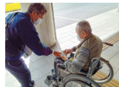
(株)ナショナルメンテナンス